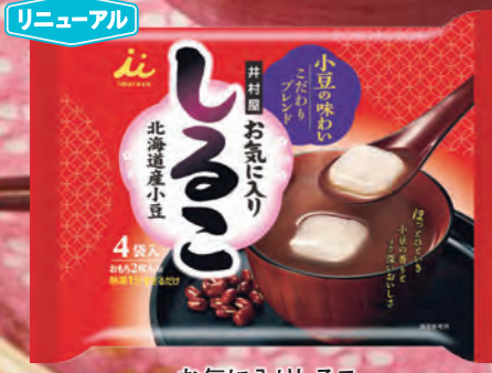
お気に入りしるこ