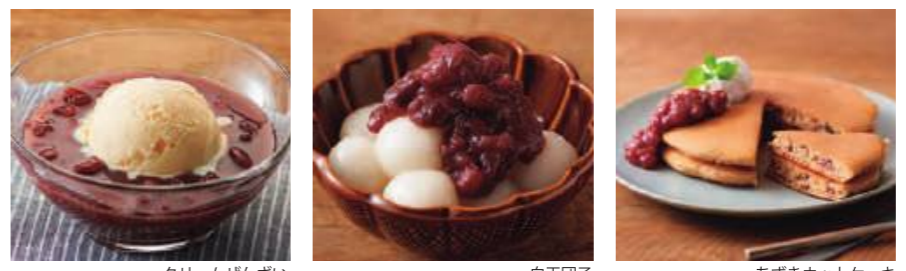
クリームぜんざい 白玉団子 あずきホットケーキ

販売什器も ご用意して おります! ※画像はイメージです。 変更する場合がございます。