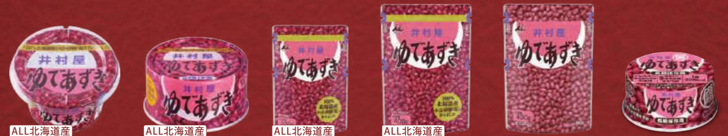
ALL北海道産 北海道カップゆであずき ALL北海道産 北海道EO-T2ゆであずき ALL北海道産 北海道パウチ ゆであずき200g ALL北海道産 北海道パウチ ゆであずき400g パウチゆであずき400g 備蓄用ゆであずき85g

じっくりと丁寧に炊きあげた、 井村屋自慢のゆであずき。 ぜんざいやあんみつ、小倉トースト、 そのままお召しあがりになるなど、 様々な使い方ができます。 あずきの風味と、懐かしさを感じる やさしい甘さをお楽しみください。